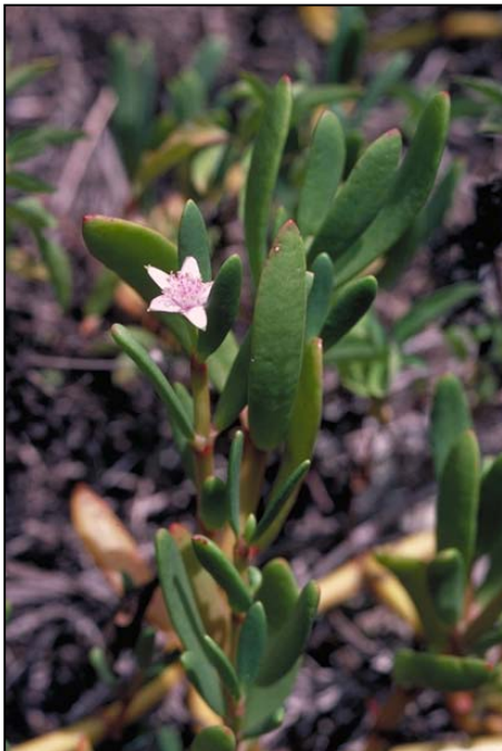
a. Detalle de la planta con flor