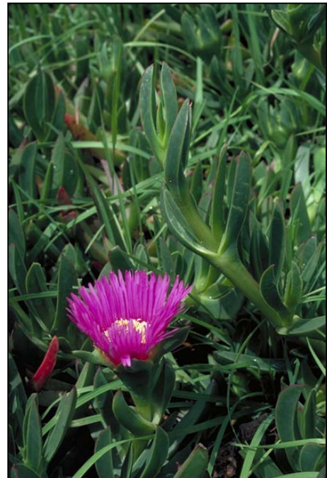
a. Detalle de la planta con flor

(Figuras extraídas de Judd et al. , 1999)