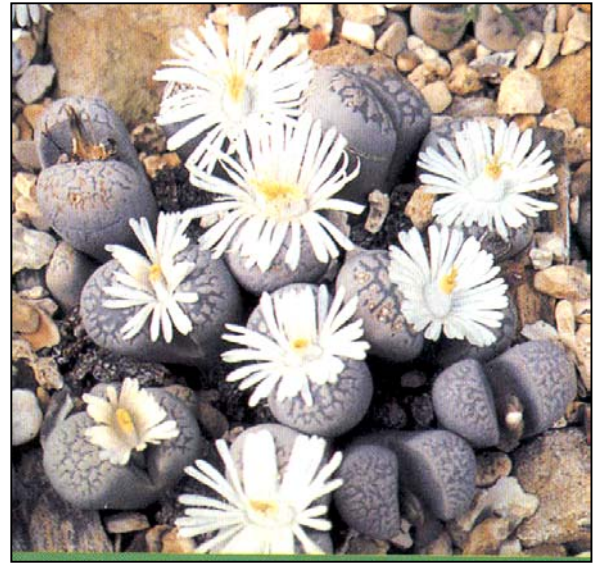
a. Aspecto general