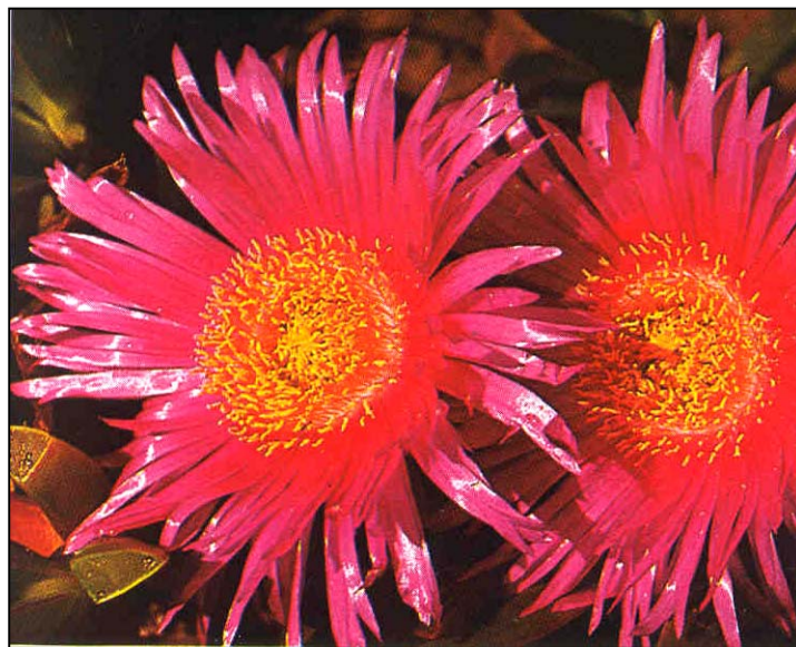
a. Detalle de las flores

(Figura extraída de Bianchini y Pantano, 1984)