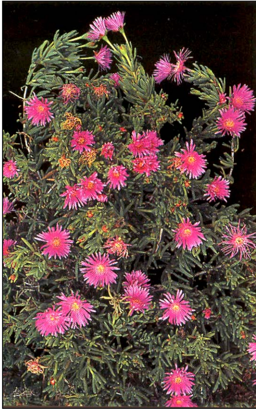
a. Aspecto general