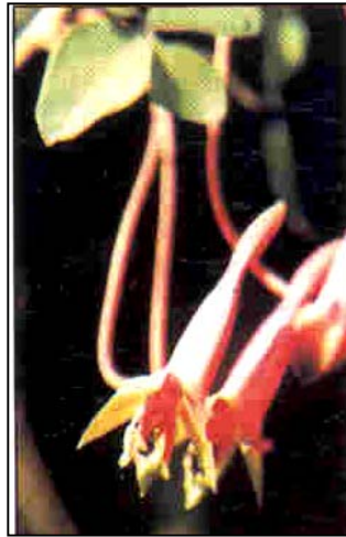
b. Detalle de las flores

(Figuras extraídas de Lahitte et al. , 1998)