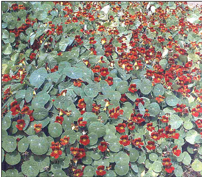
a. Aspecto general de las plantas (Extraída de Lorenzi y Moreira de Souza, 2001)