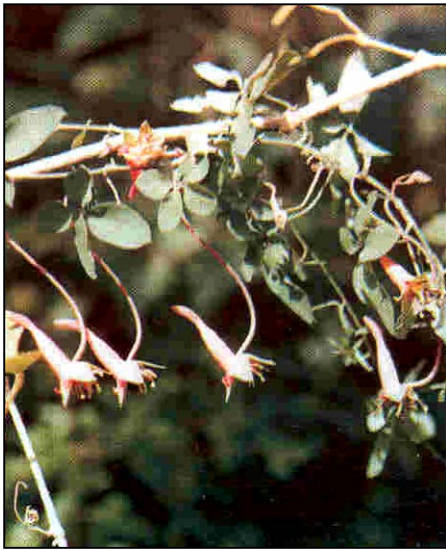
a. Aspecto general