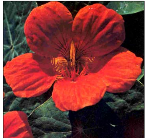
b. Detalle de las flores