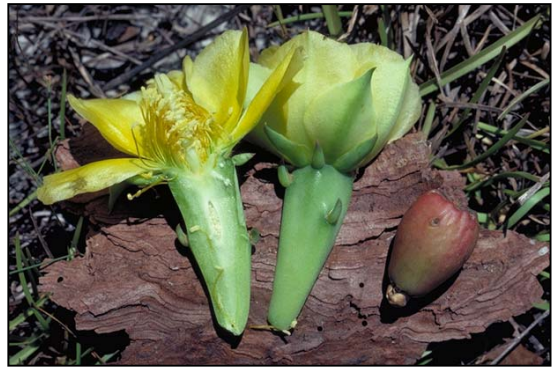
a. Flores y frutos