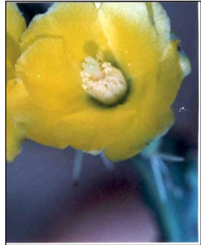
b. Detalle de la flor