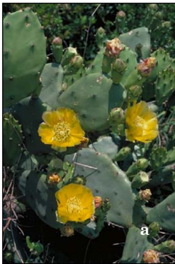
Fig. 9: Opuntia stricta