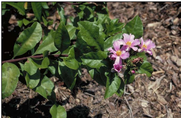
Fig. 9: Pereskia sp.