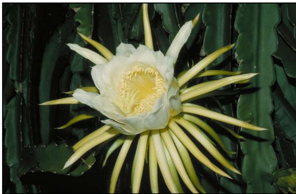
a. Detalle de la flor

(Figuras extraídas de Judd et al. , 1999)