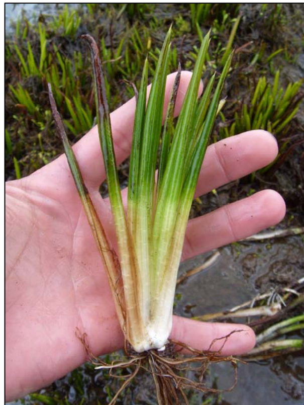
b. Planta completa