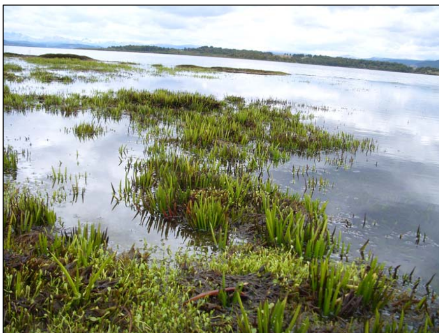
Fig.1 Isoëtes chubutiana Hickey, Macluf & W.C.Taylor